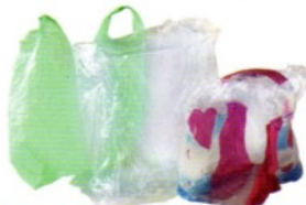
Suremballages, sacs, films en plastique