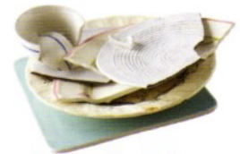
Vaisselle, faïence, Porcelaine, verres à boire