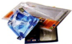
Suremballages (décoration, alimentaire)