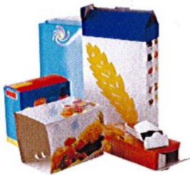
Boîtes et suremballages en carton

(Merci de retirer les embouts de type pompes et pistolets)