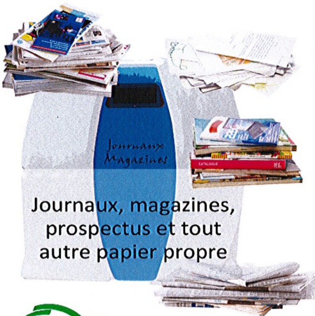
Journaux, magazines, prospectus et tout autre papier propre