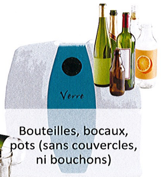
Bouteilles, bocaux, pots (sans couvercles, ni bouchons)