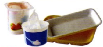
Pots de produits laitiers (yaourts, crème fraîche...) barquettes en polystyrène